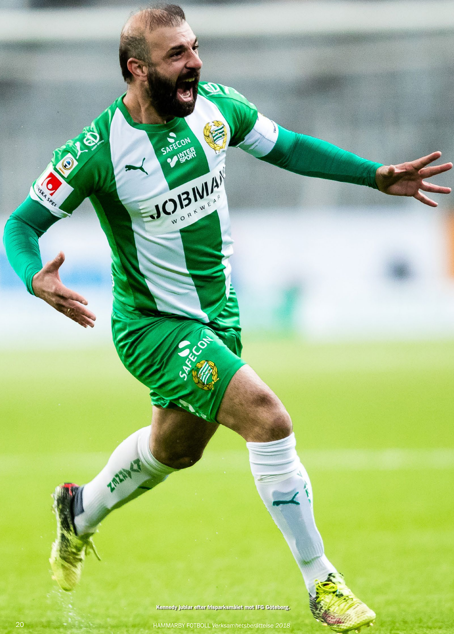
Kennedy jublar efter frisparksmålet mot IFG Göteborg.