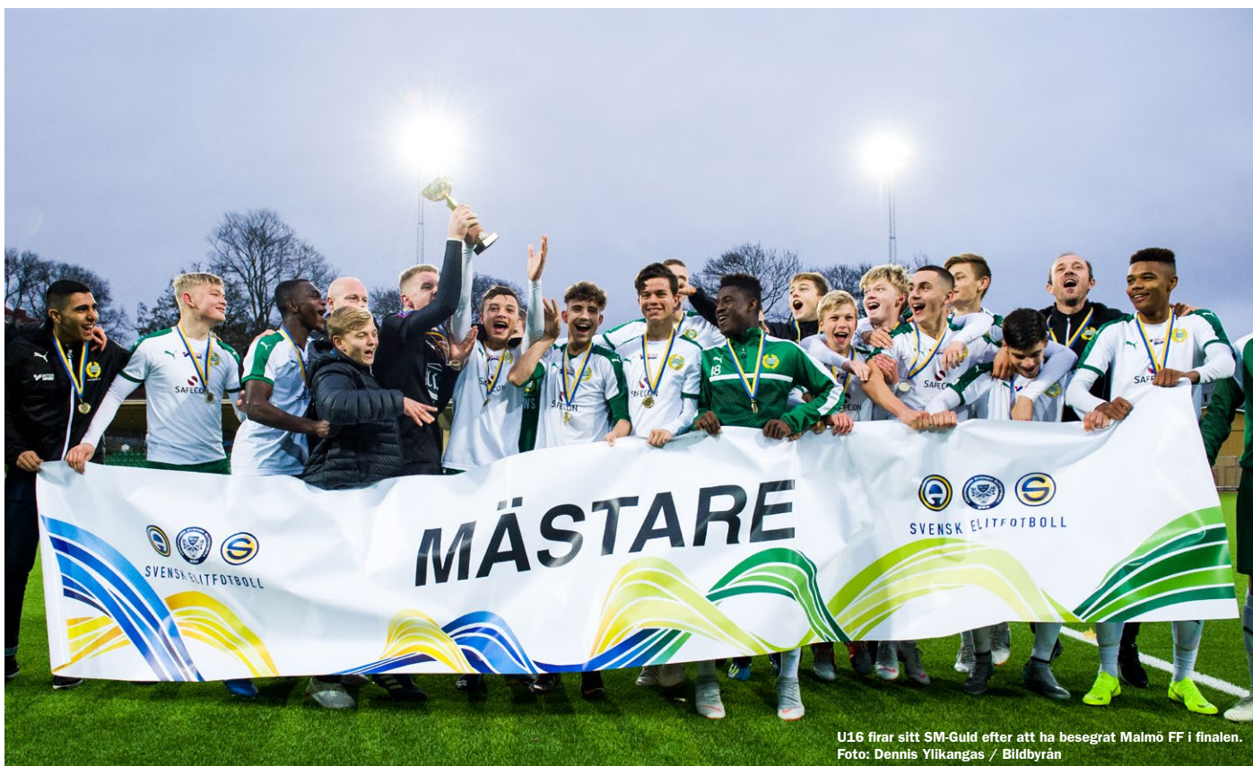
U16 firar sitt SM-Guld efter att ha besegrat Malmö FF i finalen.