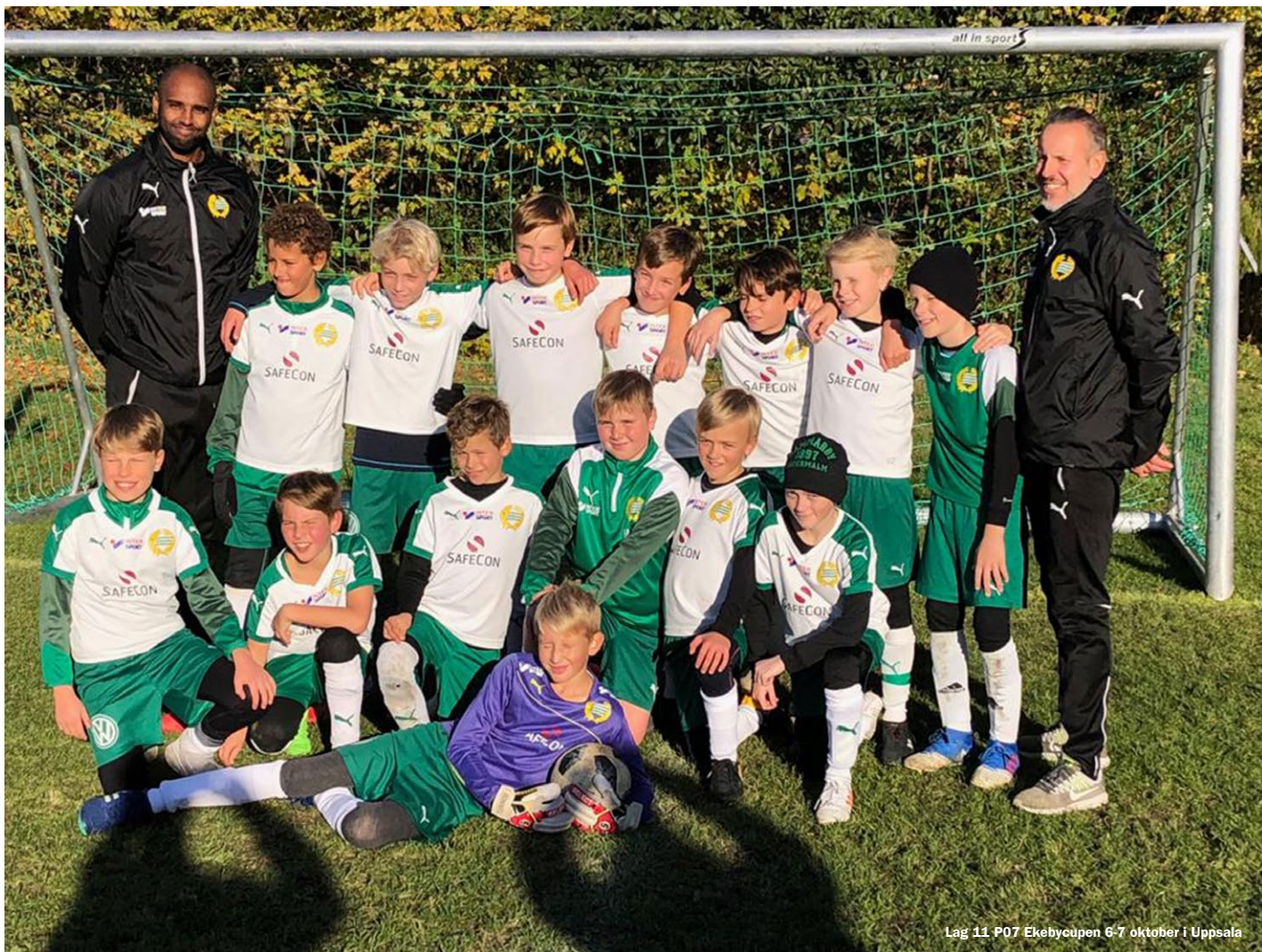
Lag 11 P07 Ekebycupen 6-7 oktober i Uppsala

Tydlig utveckling i blocket under året som gått