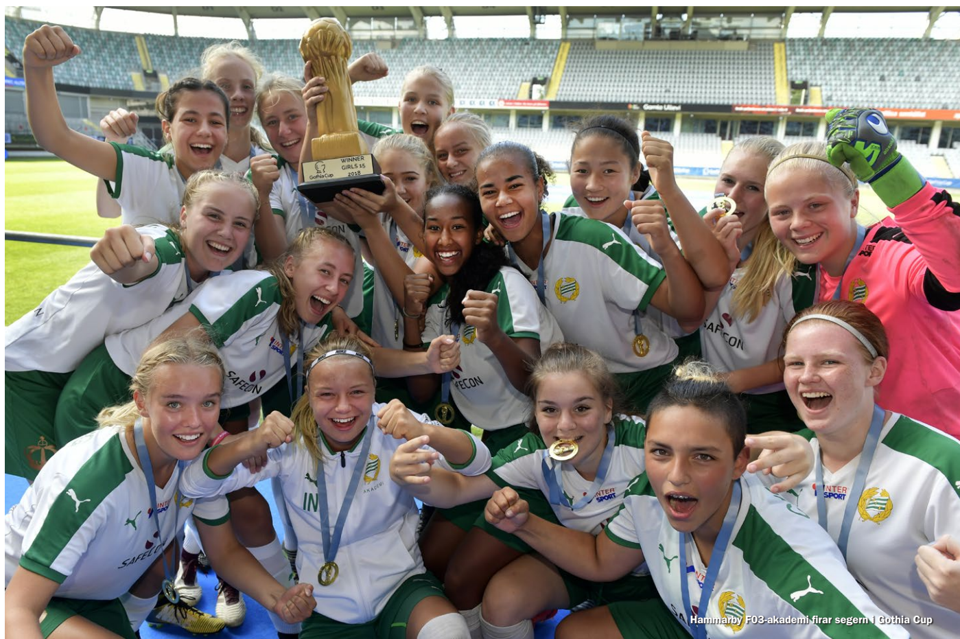
Hammarby F03-akademi firar segern i Gothia Cup